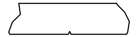
DETAIL C SCALE 0.03 : 1