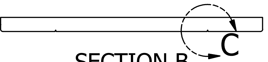
SECTION B SCALE 1 / 75